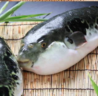
淡路島 3年とらふぐ