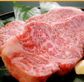
淡路ビーフ (淡路牛)